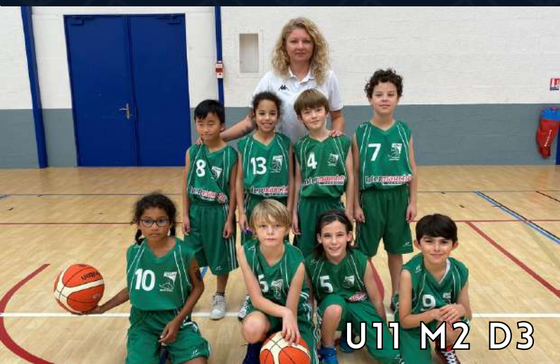
U11 M2 D3