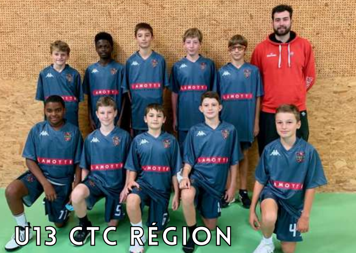
U13 CTC R gion