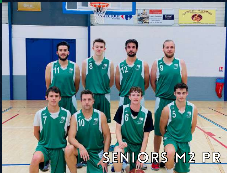
SENIORS M2 PR

"Nous avons gardé la même ossature que l'année dernière et nous avons intégré plusieurs jeunes. Cette saison nous avons comme objectif de jouer le haut de tableau comme chaque année. Nous sommes pour l'instant bien partis avec 5 victoires sur 5 matchs. Il va falloir cependant confirmer sur les matchs retours, mais je ne me fais pas de souci avec cette équipe qui a une belle dynamique !"