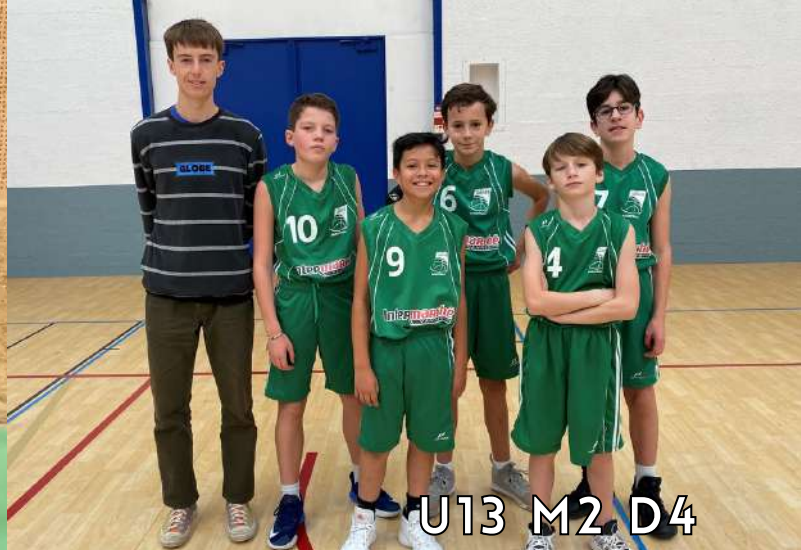
U13 M2 D4