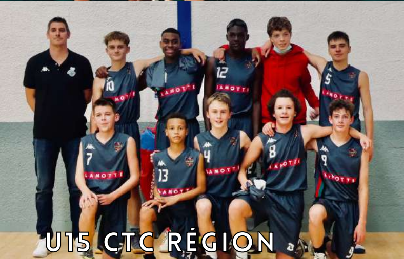
U15 CTC R gion

"L' quipe a tr s bien d marr  le championnat avec une victoire dimanche dernier. Il reste encore 3 matchs   disputer avant la coupure de No l et encore beaucoup de travail au niveau du collectif pour tenter de remporter 3 victoires et rester invaincu sur ce d but de saison. En tout cas, c'est l'objectif !"