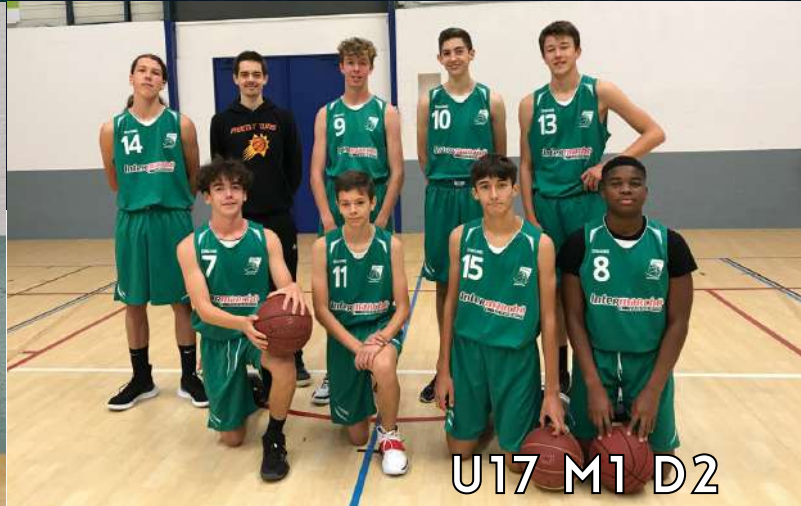
U17 M1 D2