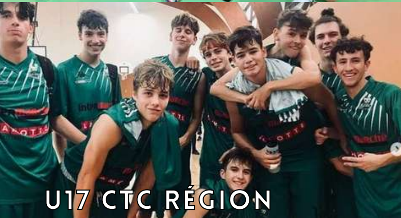
U17 CTC R gion