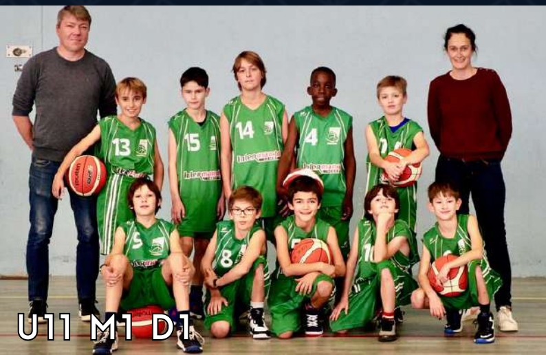
U11 M1 D1