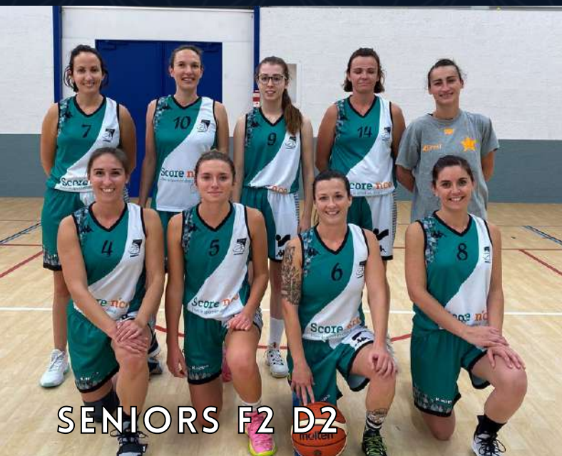
SENIORS F2 D2