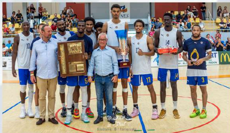
Métropolitans 92 - Vainqueur de l'édition 2022